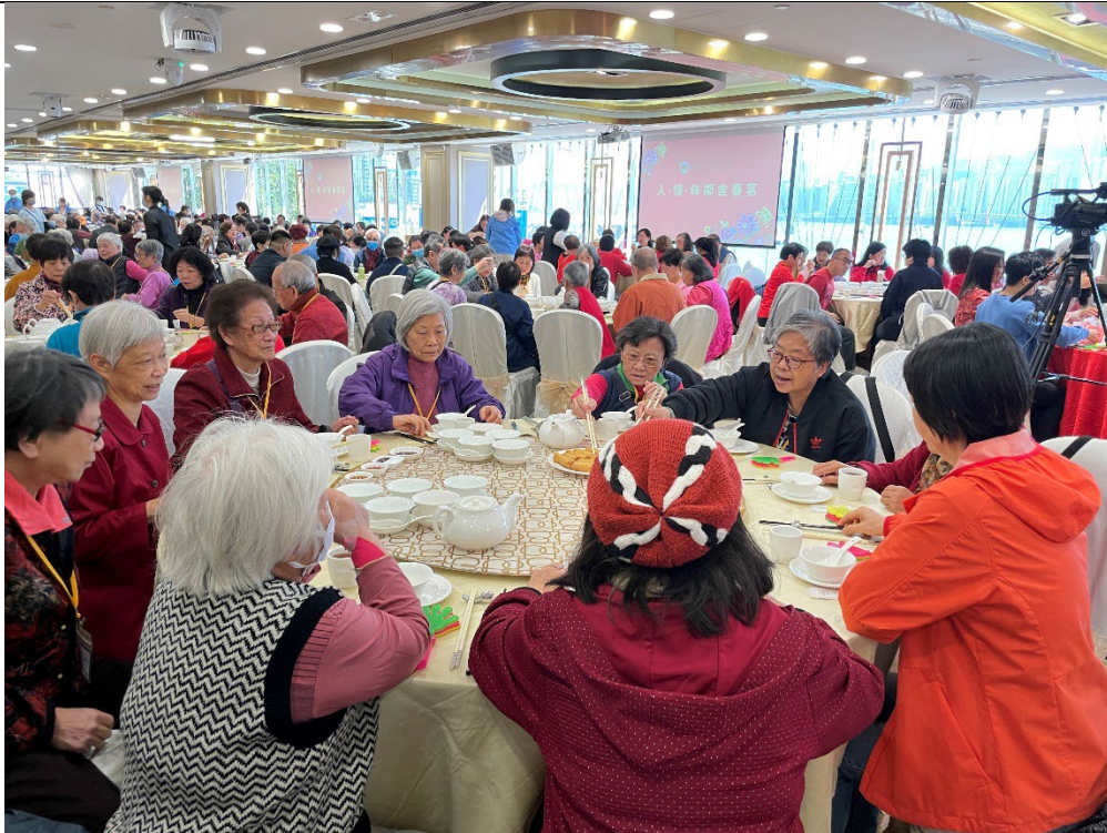
圖片三：今次春茗吸引超過 800 名會員參與，享用豐盛午宴，參加者更可獲贈新春福袋，滿載而歸。