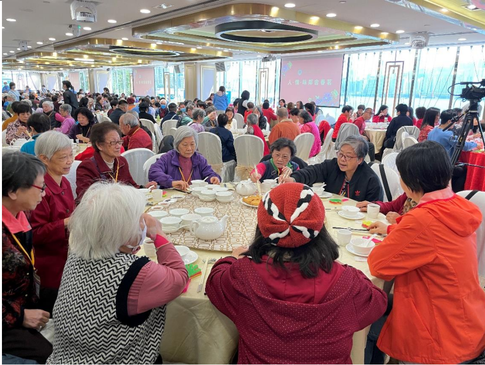
圖片三：今次春茗吸引超過 800 名會員參與，享用豐盛午宴，參加者更可獲贈新春福袋，滿載而歸。