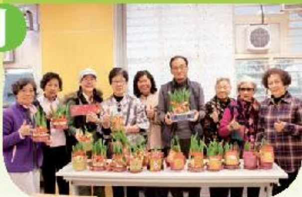
綠色心靈園藝小組

計劃舉辦共八堂小組由專業園藝治療師帶領，讓組員學習各種種植技巧，隨後成為義工，在中心舉辦種植工作坊並上門探訪三十位長者與他們分享種植及送贈植物，協助體弱、獨居或雙老長者建立社區網絡、化解負面情緒，建立健康的生活態度及正面的自我形象。