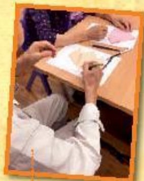
治療性及支援性小組